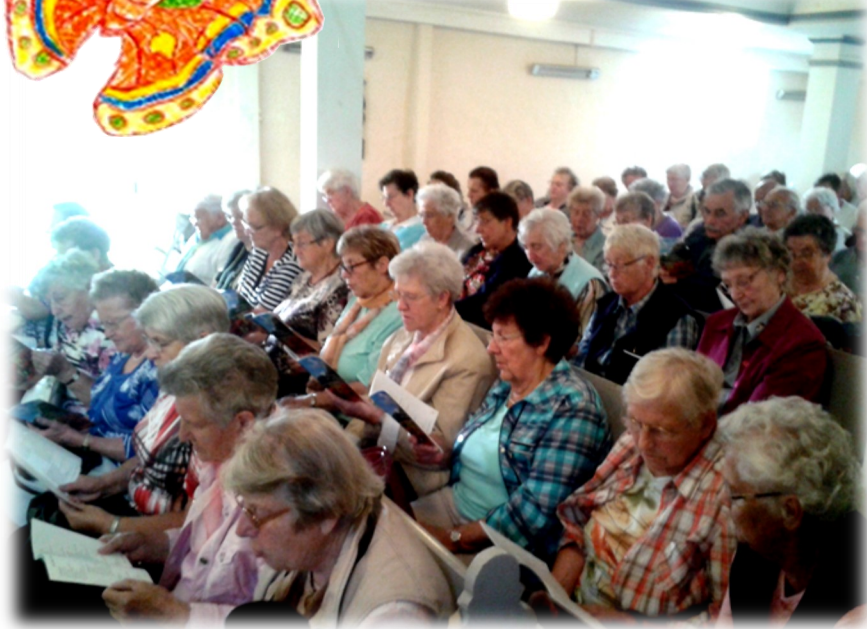
Regionaler Gemeindegottesdienst in Eßleben 2016