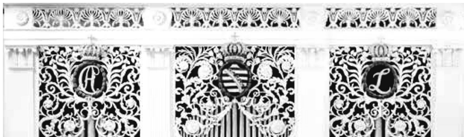
Ausschnitt vom Prospekt der Schulze-Orgel in Rastenberg mit den Initialen des Großherzogs Karl-August von Sachsen-Weimar-Eisenach und seiner Frau Luise

Am 10. September öffnen in ganz Deutschland rund 7.500 historische Baudenkmale, Parks oder archäologische Stätten ihre Türen. Das teilt die Deutsche Stiftung Denkmalschutz in Bonn als Koordinatorin der Aktion mit.