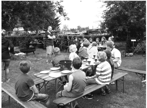
Pfadi-Camp 2017 in Roldisleben

Alle Teilnehmer brauchen festes Schuhwerk, Schlafsack, Isomatte, bei Bedarf ein Kissen und 5€ Beitrag für Lebensmittel und Materialien. Zusätzliche Lebensmittelspenden sind herzlich willkommen. Treffpunkt ist Freitag der 13. Juli 16:00 Uhr auf dem Sportplatz in Eßleben.