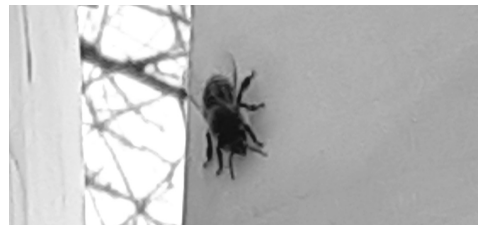
Erste Biene des Jahres – aufgenommen in Roldisleben am 10.02.2019