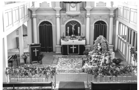
Die schöne Kirche zu Erntedank