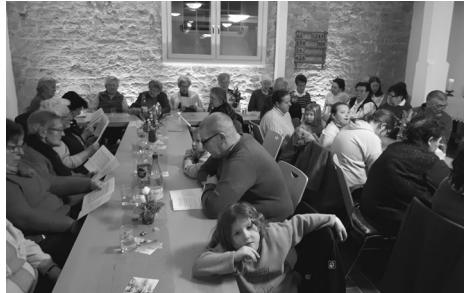
Voller Raum beim Weltgebetstag